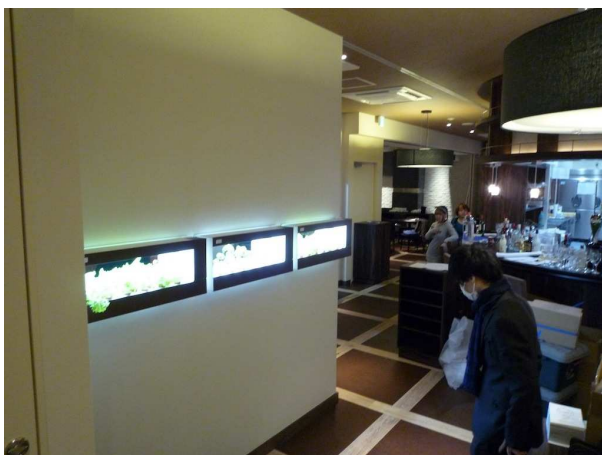
Samurai Cafe 渋谷道玄坂店に3台納入された『箱庭栽培』