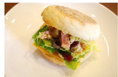
水耕栽培で育てたレタスを使った「パンチェッタコブサラダサンド」